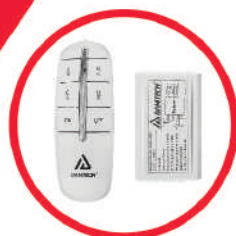
ریموت کنترل 4 کانال