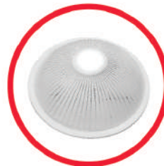
چراغ سنسوردار اضطراری