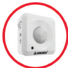
سنسور روکار حرکتی