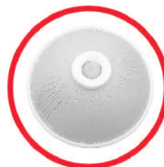
انواع چراغ سنسوردار سقفی فلزی و پلاستیکی