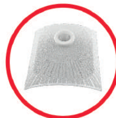
انواع چراغ سنسوردار دیواری